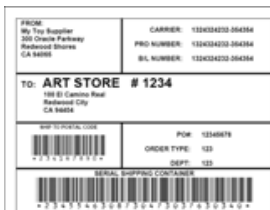
Etiquette incluant un code barre